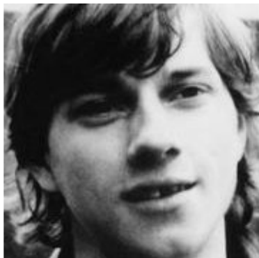
Die beiden Täter